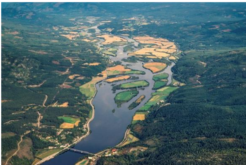
Flyfoto tatt i forbindelse med den siste fløtinga i Glomma.

Leiekjøringspriser fra Norsk Landbruk og Bedre Gardsdrift kan brukes som veiledende, inntil maksbeløpet.